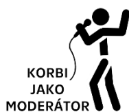
KORBI JAKO MODERÁTOR