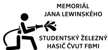
MEMORIÁL JANA LEWINSKÉHO