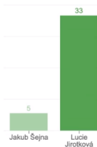
Výsledek hlasování Hlasování se zúčastnilo 39 z 44 (89%) hlasujících. Z toho neplatných: 1.

Hlasování: Hlasování o studentském zástupci